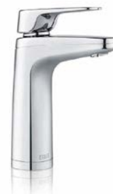
XL -dispenser med kran