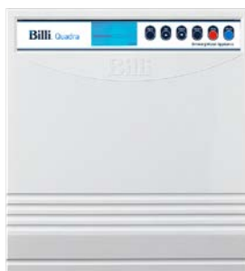
Quadra (innebygd modell)